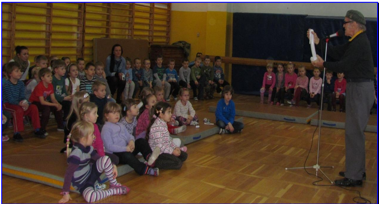
SPOSOBY FORMOWANIA BALONIKÓW

Tym razem uczestniczyliśmy w manualnych zajęciach warsztatowych, które bardzo przypadły wszystkim do gustu. Oto, co się działo: