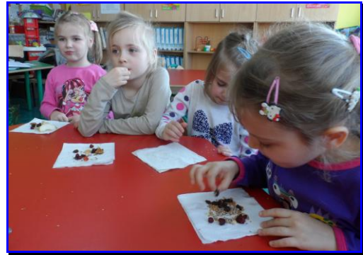
Degustacja wspólnie przygotowanej mieszanki owocowej.