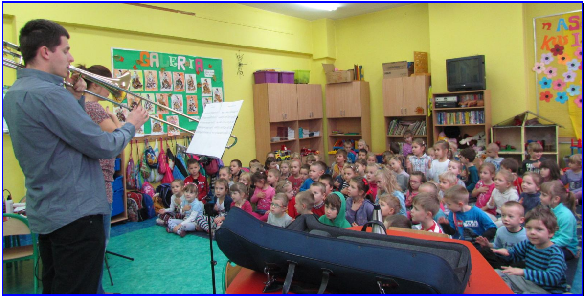
Zasłuchani w „Balladę o krasnalach”